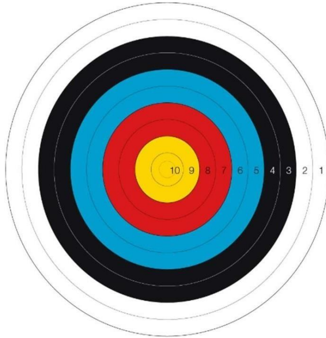
Single Face 122 cm 10 ring